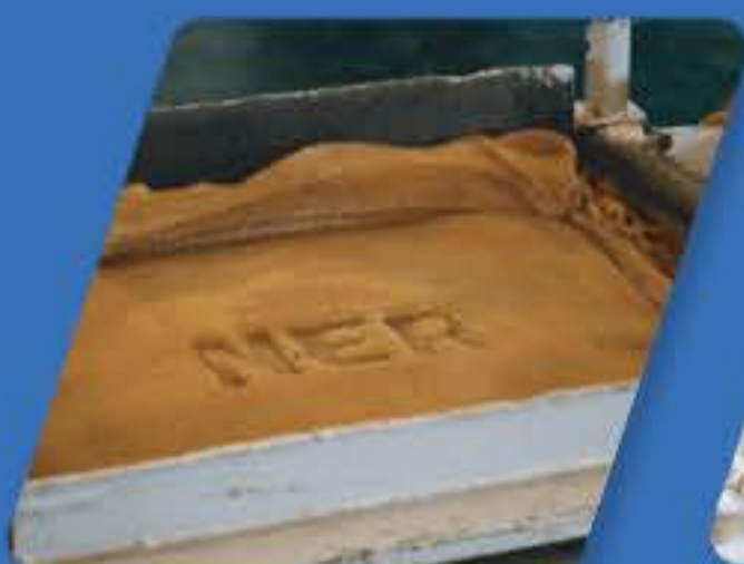
ยางแผ่นรมควัน