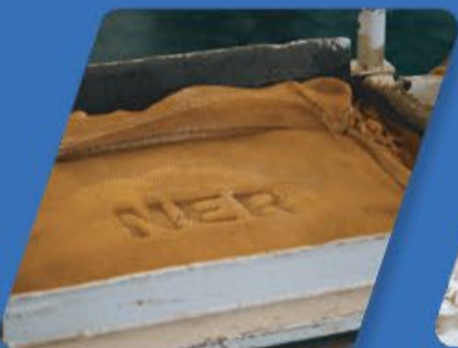
ยางแผ่นรมควัน