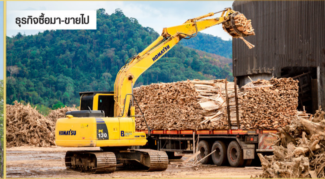
ธุรกิจซื้อมา-ขายไป