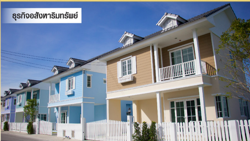
ธุรกิจอสังหาริมทรัพย์