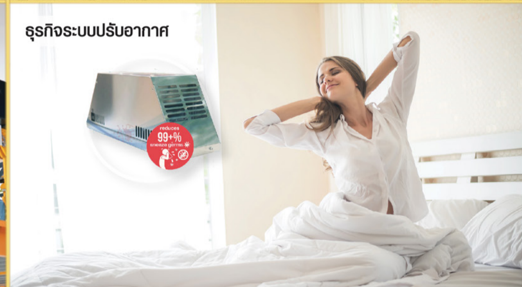
ธุรกิจระบบปรับอากาศ