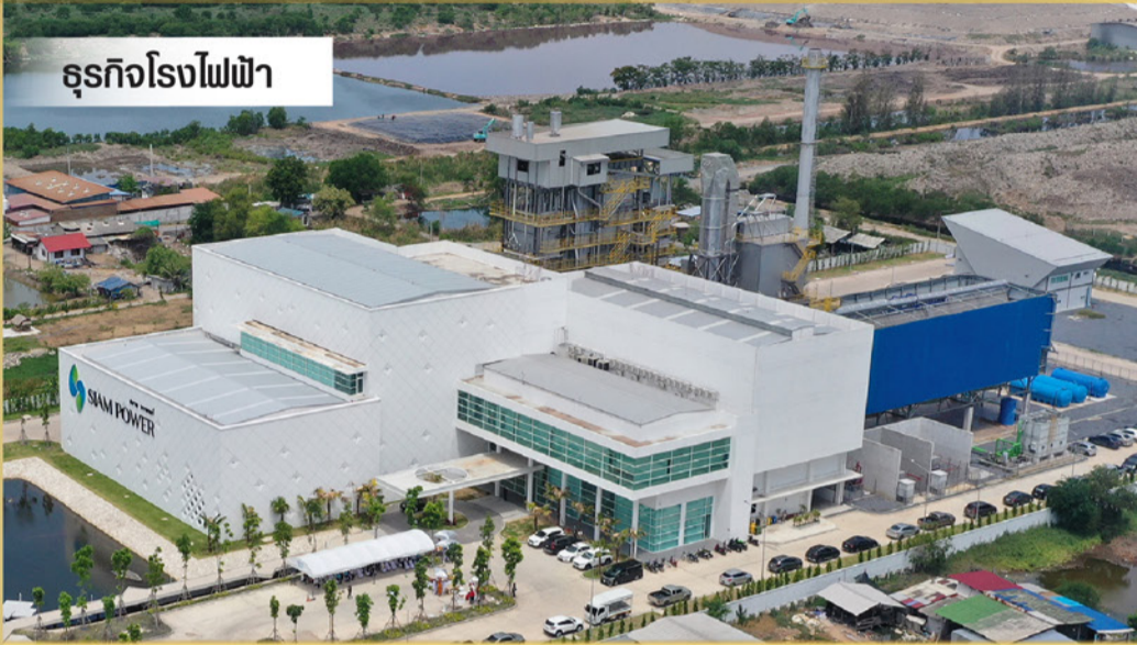
ธุรกิจโรงไฟฟ้า