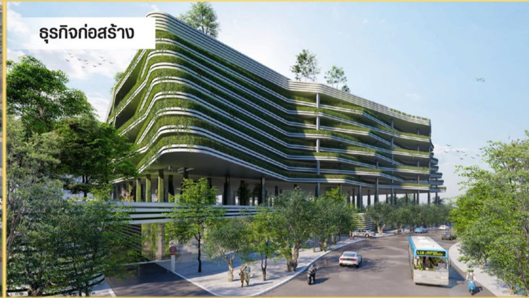
ธุรกิจก่อสร้าง