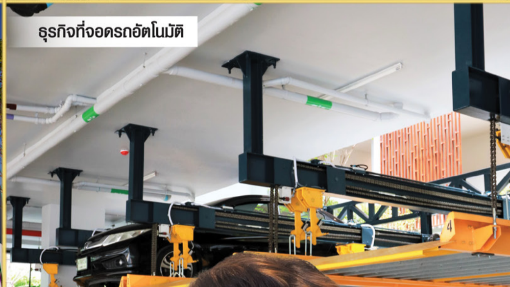
ธุรกิจที่จอดรถอัตโนมัติ