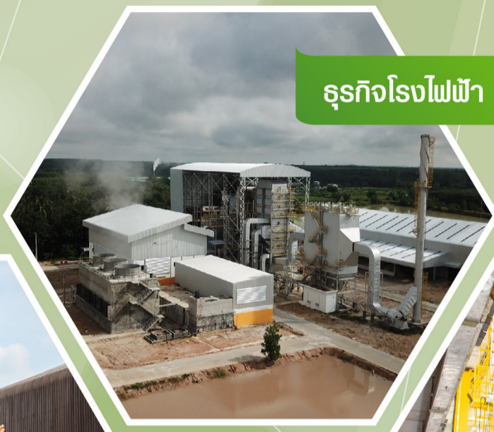
ธุรกิจโรงไฟฟ้า