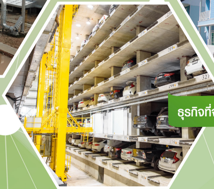
ธุรกิจที่จอดรถอัตโนมัติ