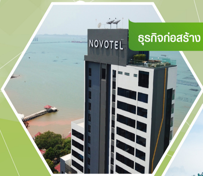
ธุรกิจก่อสร้าง

33 ปี ผลิตผลงานแห่งความสำเร็จอย่างยั่งยืน