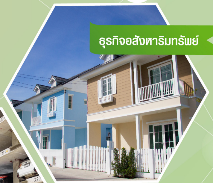
ธุรกิจอสังหาริมทรัพย์