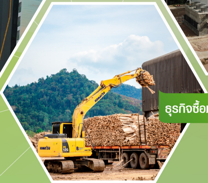
ธุรกิจซื้อขายไม้