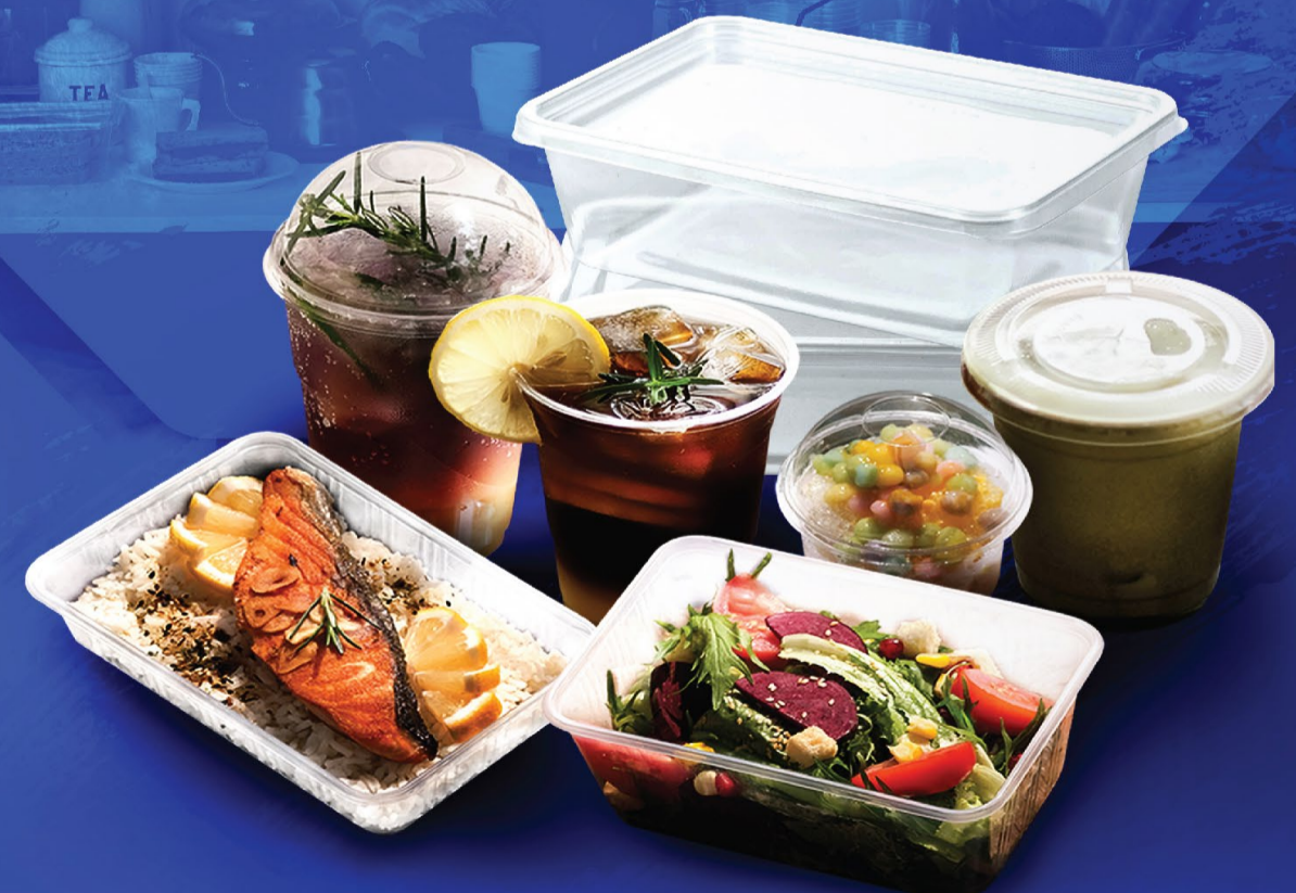
ธุรกิจบรรจุภัณฑ์พลาสติก สำหรับอาหารและเครื่องดื่ม