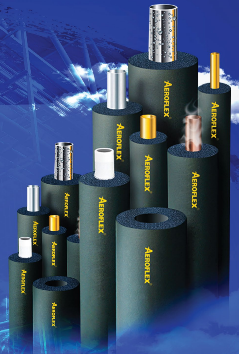
ธุรกิจฉนวนยางกันความร้อน/เย็น

นวัตกรรมโพลีเมอร์และพลาสติก เพื่ออนาคตที่ดีกว่า