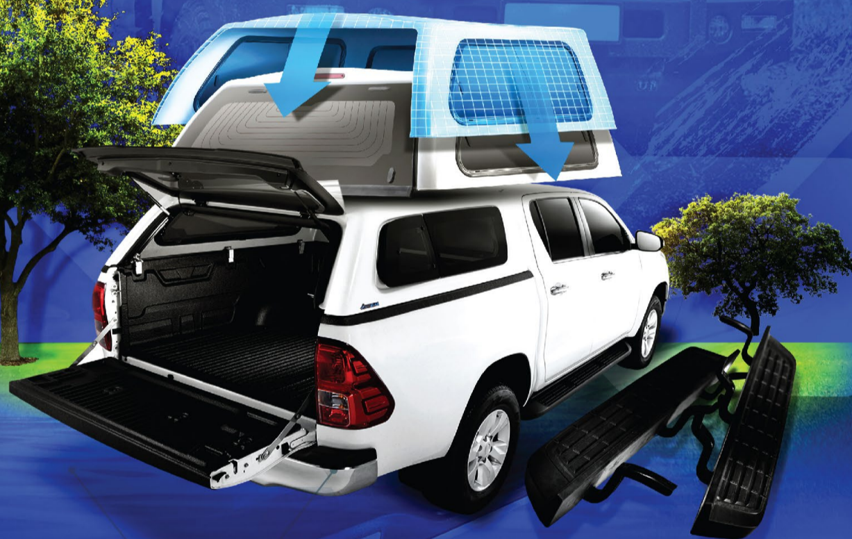
ธุรกิจชิ้นส่วนอุปกรณ์ และตกแต่งยานยนต์