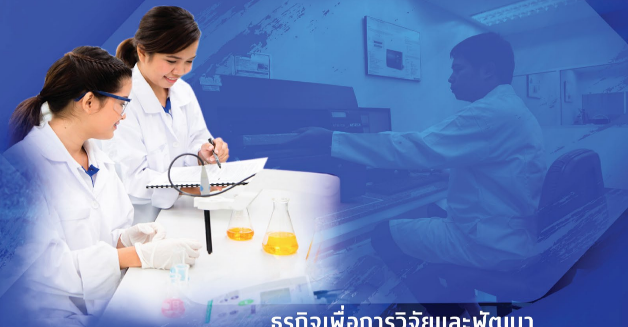
ธุรกิจเพื่อการวิจัยและพัฒนา