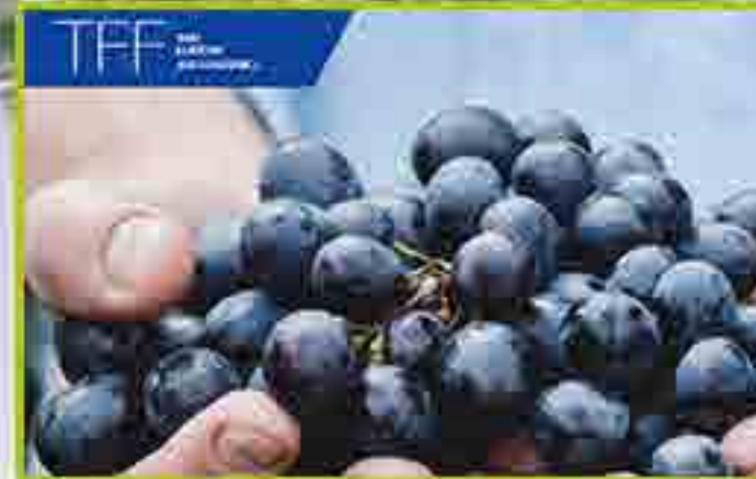
Thai Flavour And Fragrance Co.,Ltd.