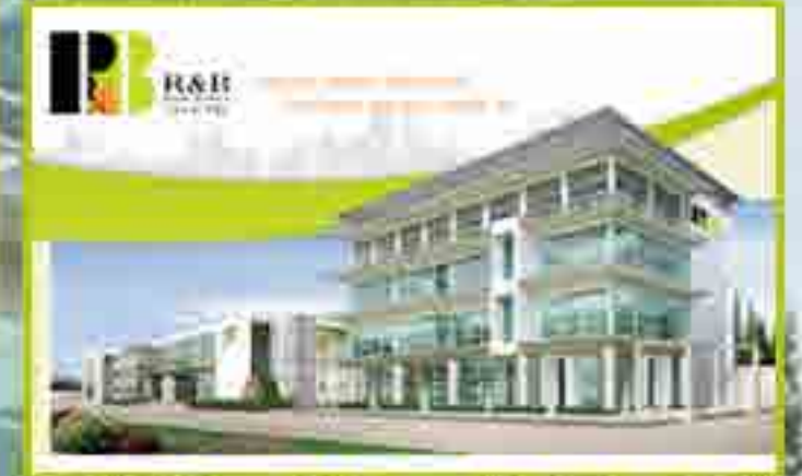
R&B Food Supply Co.,Ltd.