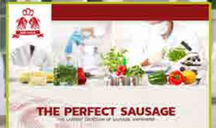
Best Odour Co.,Ltd

"...การพัฒนาและวิจัยนวัตกรรมพร้อมทั้งบริหารจัดการ supply chain ให้มีประสิทธิภาพ คือหัวใจหลักของความสำเร็จ..."