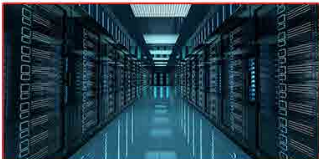
ธุรกิจก่อสร้างศูนย์ข้อมูล และระบบเทคโนโลยีสารสนเทศ (Data Center & IT Infrastructure)