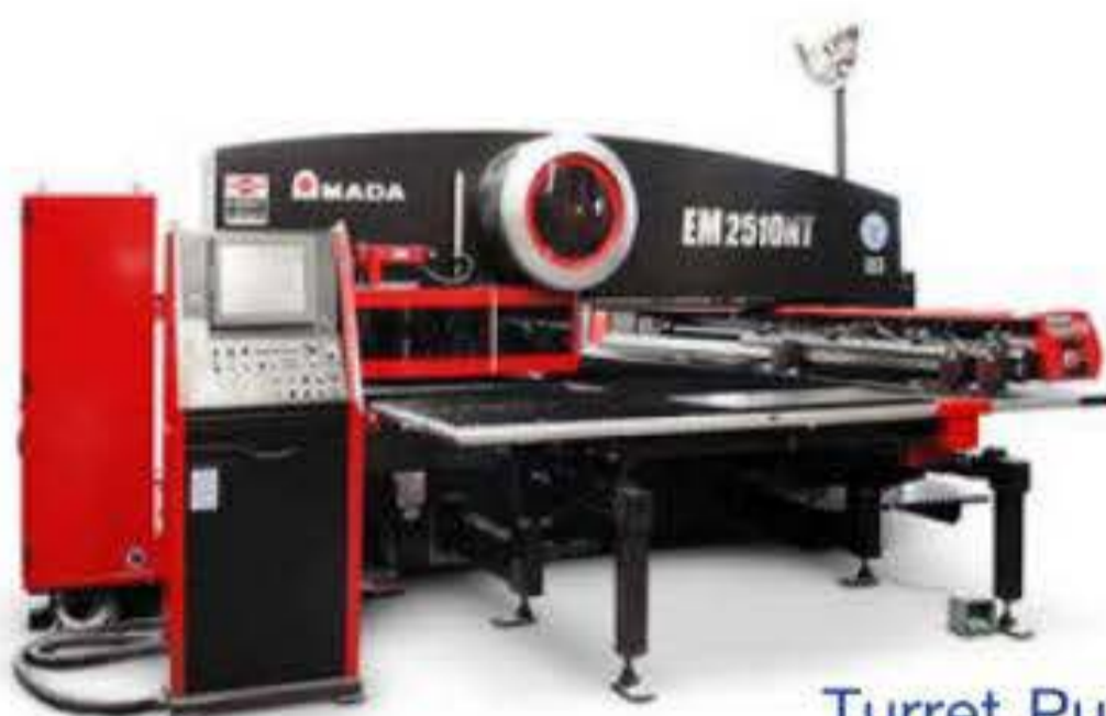
Turret Punching Machine