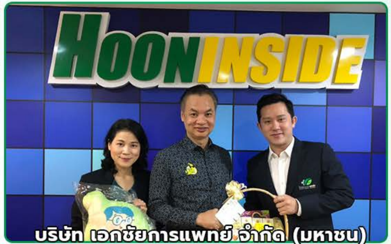
บริษัท เอกชัยการแพทย์ จำกัด (มหาชน)