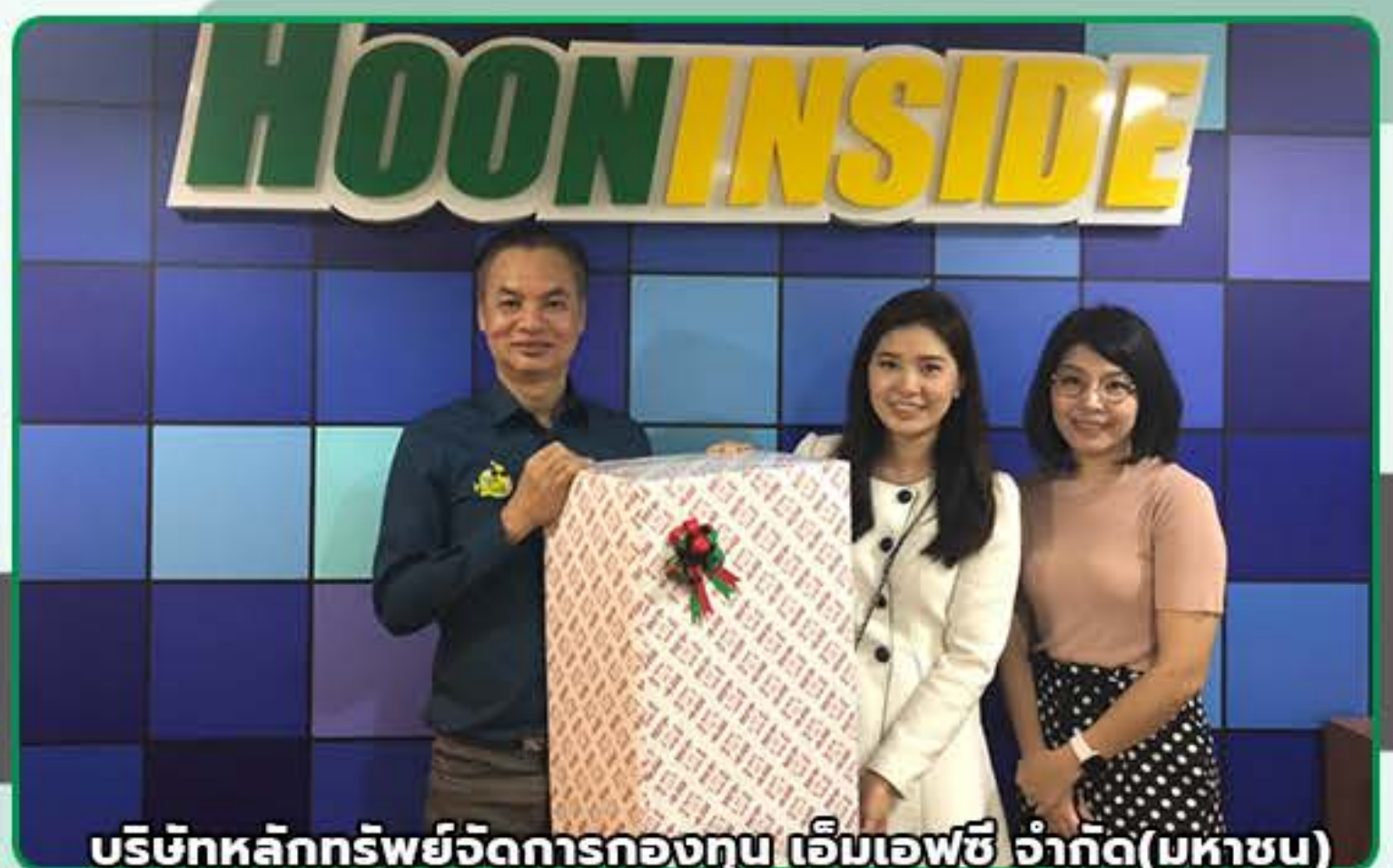
บริษัทหลักทรัพย์จัดการกองทุน เอ็มเอฟซี จำกัด(มหาชน)