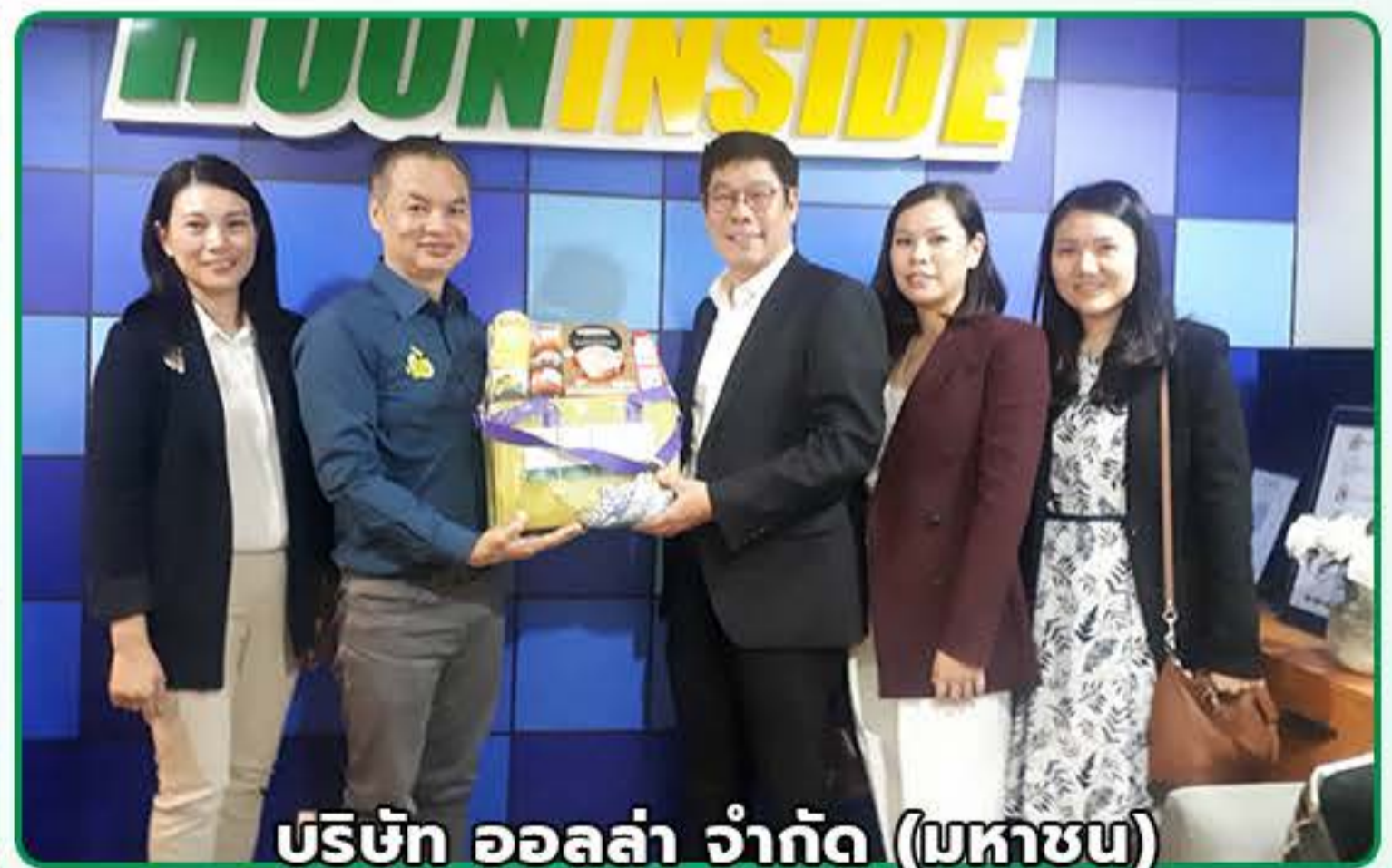
บริษัท ออลล่า จำกัด (มหาชน)