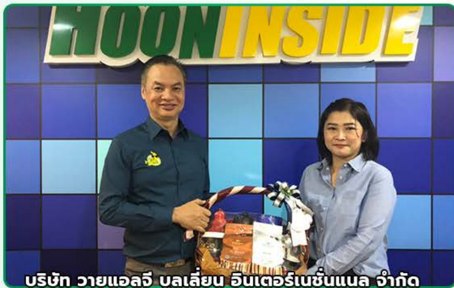
บริษัท วายแอลวี บูลเลี่ยน อินเตอร์เนชั่นแนล จำกัด