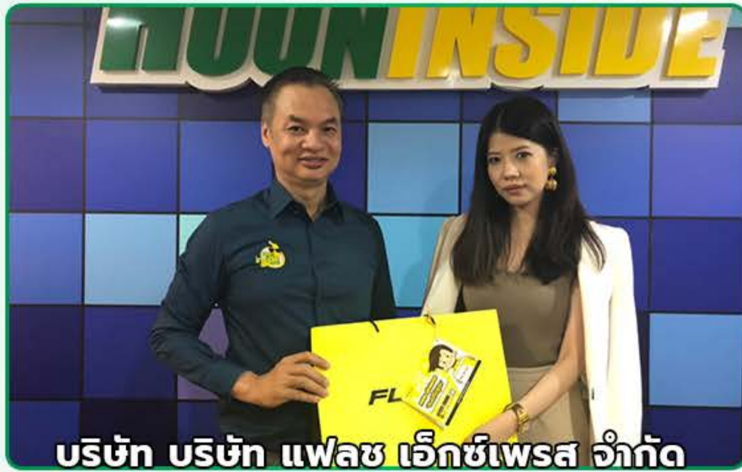
บริษัท บริษัท แฟลช เอ็กซ์เพรส จำกัด